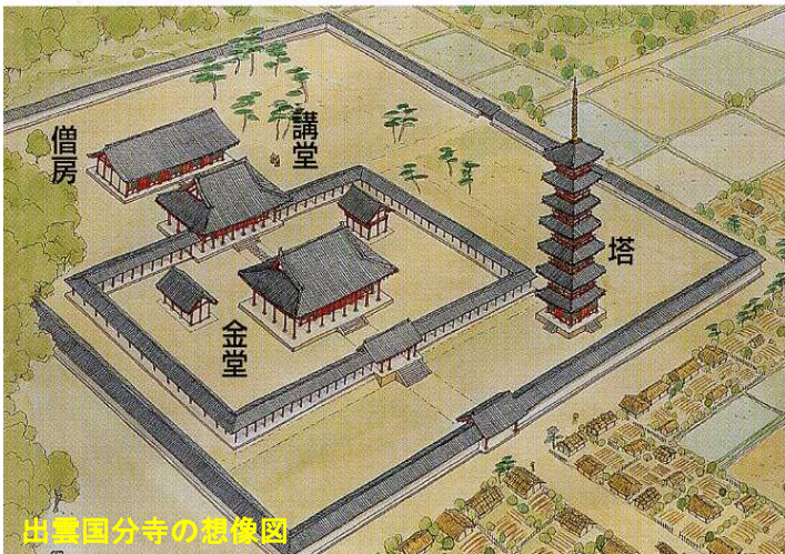
出雲国分寺の想像図

Challenge ① 下の3つの写真は、島根県にある国分寺跡や国分尼寺跡です。それぞれ地図のどの番号の場所になりますか？あてはまる番号を( )に書きましょう。