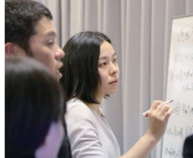
パターン・ランゲージ:core3 共に汗かく伴走者

「あなた」と「私」ではなく「私たち」でいく。違う組織・地域のことは他人事としてとらえてしまい、一体感がうまくいかない。そこで、自分だけでなく、相手を含む大きな主題で捉え、語るようにする。