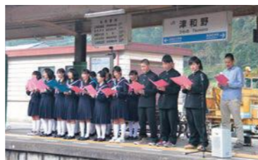
水害で列車が来なくなった駅のホームで、町民への声援と線路の復旧を願い、高校生主催の「駅のステージ」を開催。町民約70名が集まり、復旧への想いを新たにしました。

「自分が起業する事で、高校生だけでなく町の人や同僚にも地方で仕事を生み出せることを示せるんじゃないか。」と、自ら挑戦する姿勢でいることを意識する。新しい現場に飛び込み、人や情報をつなぎ、選択肢を生み出す。教育の現場で0から1を作り続けている。