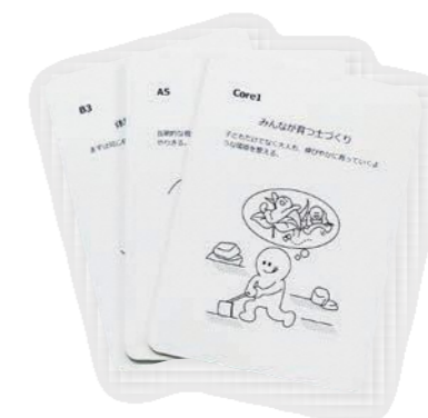
学校と地域をつなぐパターン・ランゲージ -社会に開かれた学校をつくる旅-

例) 公営塾など学校外の学習環境の整備、地域活動・社会体験・海外留学の支援など。