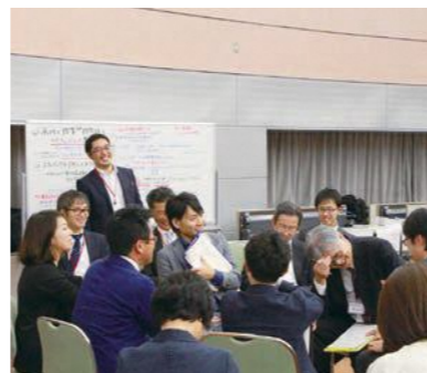
パターン・ランゲージ:C7 未来への対話

経験してきたことの違いや立場の違いをあえて活かす。先生や行政職員と異なる視点を持ち、違う立場で存在することの意味を自覚し、違いを活かすための行動も大切にする。