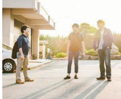
パターン・ランゲージ:C1 「WE」で語る

「あなた」と「私」ではなく「私たち」でいく。違う組織・地域のことは他人事としてとらえてしまい、一体感がうまくいかない。そこで、自分だけでなく、相手を含む大きな主題で捉え、語るようにする。