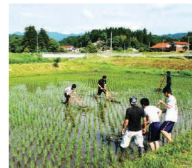
島根県におけるコーディネーターの主な役割,3 地域社会での 学習環境・学習機会の整備

先生や行政の人、地域の人と一緒に新しいことに取り組むために、定期的に熱く語り合う機会をつくり、成功イメージ(実現したい姿とそこまでのプロセス)を共有する。