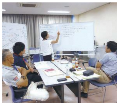
島根県におけるコーディネーターの主な役割,1 高校と地域社会(行政、企業、NPO等) の協働体制の構築

地域外にいる人も含めて、いく仲間を増やしたい。3段階でやる段階ではやりがいがあっても、実際にやるといって、実もしっかり伝えるようにする。