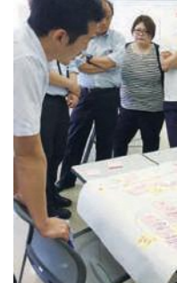
パターン・ランゲージ:N ねばれる仲間

地域外にいる人も含めて、いく仲間を増やしたい。3段階でやる段階ではやりがいがあっても、実際にやるといって、実もしっかり伝えるようにする。