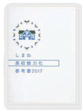
しまね 高校魅力化参考書

高校魅力化に取り組む各現場に蓄積されてきた知見や経験を集めた参考書です。あくまで「参考書」ですので、この冊子をもとに、各現場で議論を尽くし実践するための手がかりに。