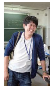
パターン・ランゲージ:A リスペクトから

学校・地域で「コーディネーター」の役割を担う人が、現場で一步踏み出すための実践のヒント集です。島根県内のコーディネーターの実際の経験則をもとにつくられていますが、多くの人が実践できるように抽象化してあります。