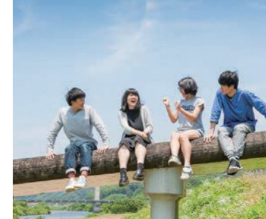
島根県におけるコーディネーターの主な役割,2 地域社会に開かれた カリキュラムの推進

例) 県外や海外からの生徒募集、留学生受け入れ、寮・下宿等の整備、ホームステイ先の調整など。