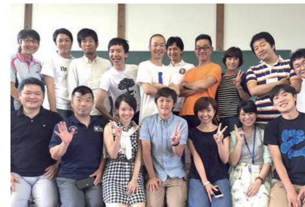
島根県高校魅力化コーディネーターdata (2018年10月現在)