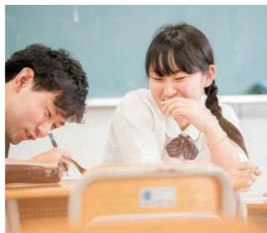
パターン・ランゲージ:B8 ちがうことの意味

経験してきたことの違いや立場の違いをあえて活かす。先生や行政職員と異なる視点を持ち、違う立場で存在することの意味を自覚し、違いを活かすための行動も大切にする。