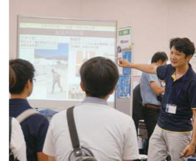
島根県におけるコーディネーターの主な役割,4 新たな人の流れと 多様性ある教育環境の創出

同じ方向を目指して、最後まで一緒に走りきる。自分だけでは達成できないことを、周りの人と一緒に成し遂げたい。