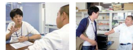
放課後には気になる生徒とも面談。生徒の声も重要な財産。ただ話を聞くだけでなく、今後に使えるツールの試行も行う。

新潟市出身。東京学芸大学卒業後、株式会社セルムにて大手企業の人材開発に従事。2014年NPOカタリバに転職。キャリア学習プログラム「カタリ場」の首都圏事業責任者として活動。2017年4月からは福島県双葉郡にてコラボ・スクール「双葉みらいラボ」を立ち上げ、拠点長に従事すると共に、福島県立ふたば未来学園高校で学習コーディネーターとして教育の魅力化に取り組む。