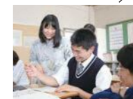
「未来創造探究」では、先生と一緒に生徒と向き合う。先生の個性や主体性を引き出しつつ、生徒にとって良い学びを作るため、日々試行錯誤。