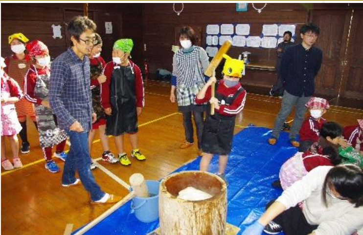
都万っ子祭りでもちつき交流