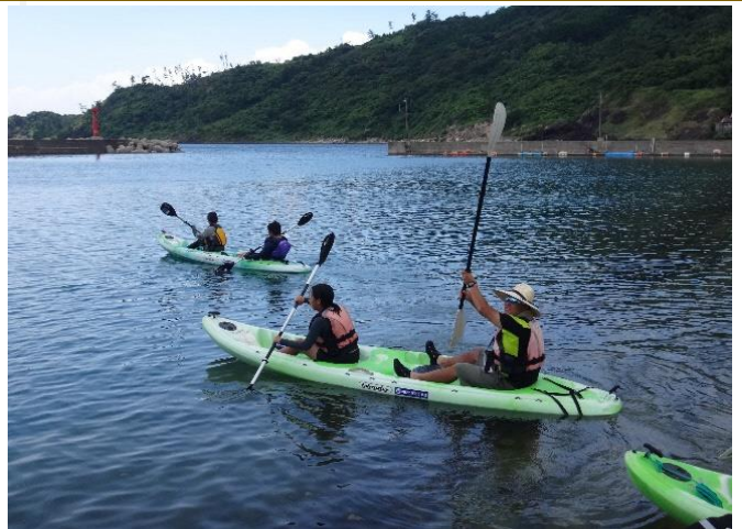
公民館が関わる ふるさとキャンプ