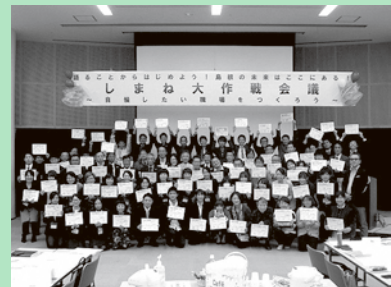
〜昨年の集合写真より〜