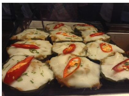
▲ホーモックジェー(野菜のココナツカレー蒸)