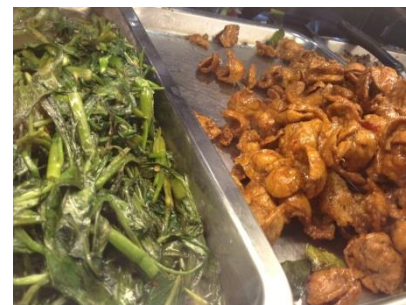
▲パッパックブン(空心菜炒め)とムートージェー(模擬豚肉を使った唐揚げ)

島根・ビジネスサポート・オフィス Shimane Business Support Office(Bangkok)