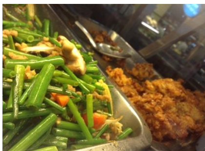
▲パットムホーム(葱の炒め)と、ガイトージェー(模擬鶏肉を使った唐揚げ)

ギンジェーの慣習は現在では中華系以外のタイ人にも広まり、今ではタイ人の宗教観や倫理観と密接に結びついています。ジェー料理は野菜や綿豆腐しか使われず、本来はほとんど味がありません。しかし、時代が進むにつれ、野菜が苦手な人でもギンジェーに参加できるよう、大豆から肉を模倣して作られたベジミートを使用するなど、食べやすいメニューが沢山でてきました。最近販売されているギンジェー用の肉は本物の肉そっくりに作られているため、ジェー料理かどうかを確認する際はそのお店に「齋」の文字が書かれた黄色い旗があるかどうかを確認してください。皆さんもこの期間にタイに訪れたら、是非、ギンジェー料理を試してみてください。