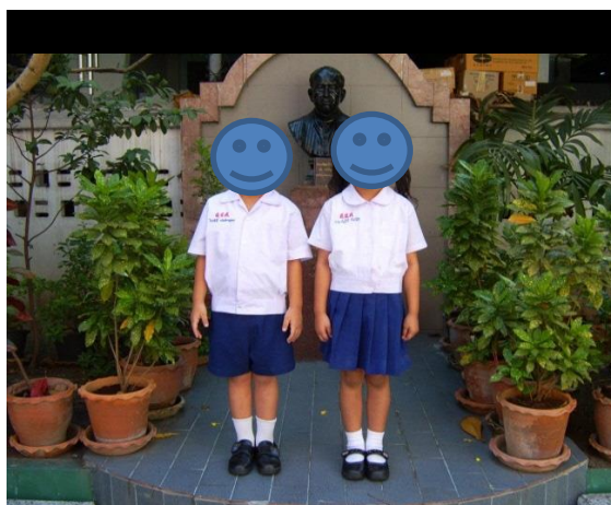
アヌバーン(幼稚園)の制服

タイの学校には制服があります。日本にもあるのでこの点は変わらないかもしれませんが、違うのは大 学生になっても制服がある点です。