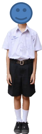
マタヨム 1-3(中学校)の制服