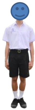
マタヨム 4-6(高校)の制服