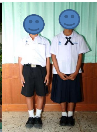
プラトム 1-6(小学校)の制服