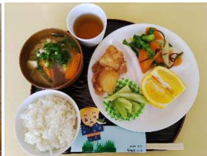
分づき米のごはんとおかず