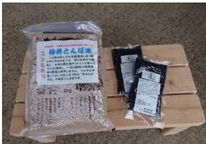
ブランド化した商品(左:とんぼ米、右:黒米)

学習会に積極的に参加し、県機関や認証機関にも相談を重ね、「とんぼ米」、「エコロ米」を栽培していたほ場を中心に有機JAS認証申請。