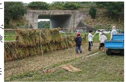
R4年収穫体験会の様子

販売先の消費者に参加を呼びかけて、田んぼの生き物調べや田植え、収穫体験などを通じて生産過程の理解を促すことで、有機JAS米本来の価値を情報発信。