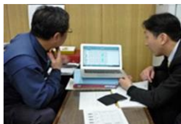
（専門家による経営指導）