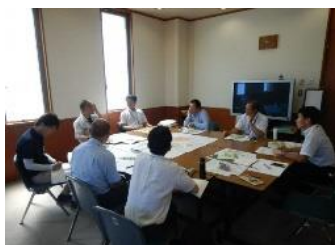
（森林経営推進センターによる業務支援）

【実績】 新規就業者確保に向けたPR動画作成、 中小企業診断士等の専門家による事業体の経営指導 4事業体、19回