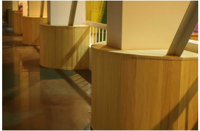
鉄骨柱脚補強部分