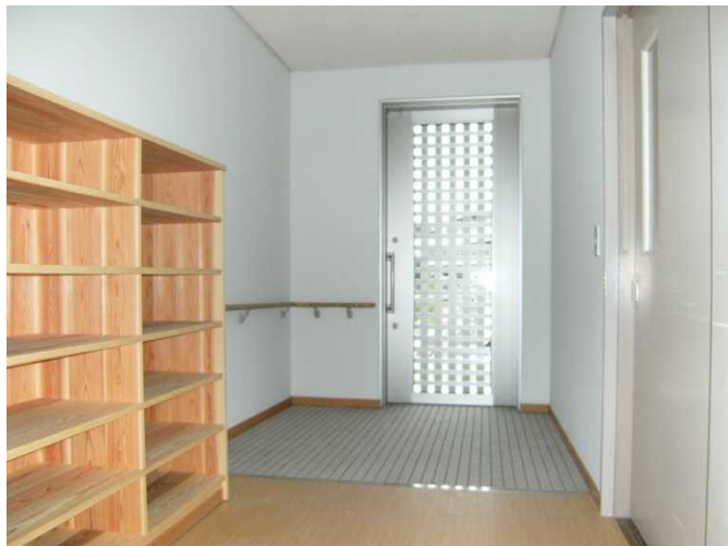
玄関：一の谷集会所