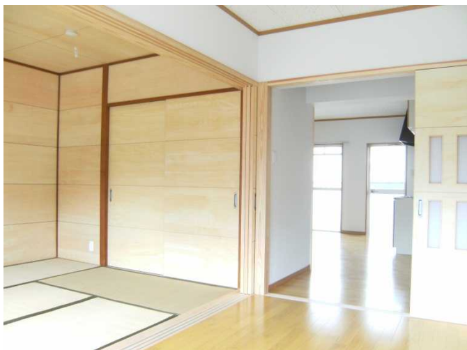
内観：一の谷団地 316 号室