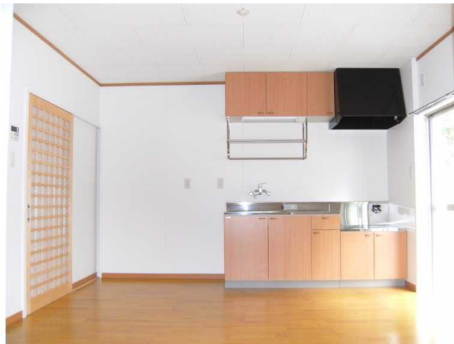
内観：大津団地 318 号室