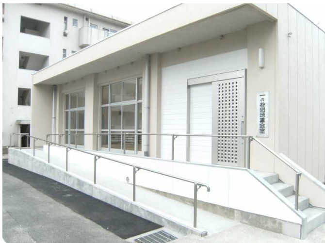
外観：一の谷集会所