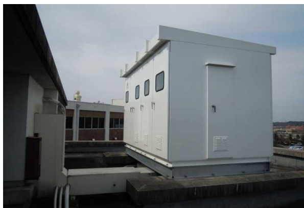
キュービクル（生物工学棟）