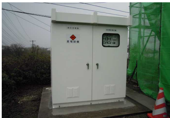
キュービクル（果樹科棟）