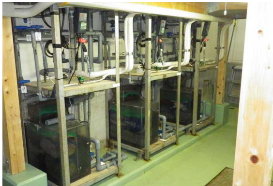
宍道湖自然館 チラーユニット