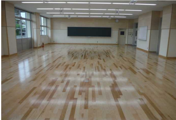
建築実習棟 製図室