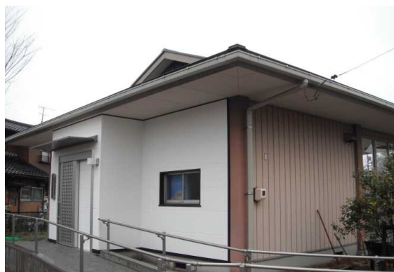
大津団地集会所バリアフリー改修