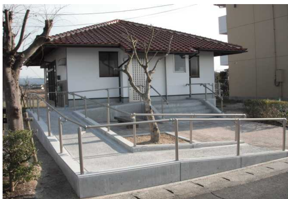
有原団地集会所バリアフリー改修