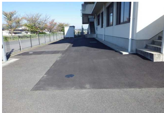
平田広域交番 下水道接続状況