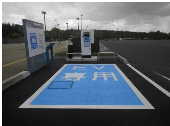
電気自動車急速充電器