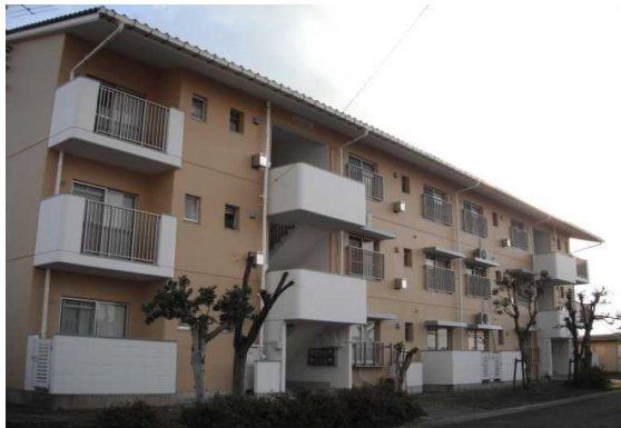
有原団地1号棟外壁改修