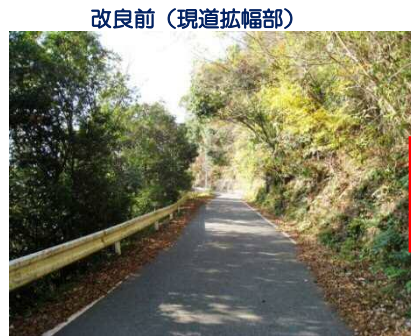
改良前（現道拡幅部）