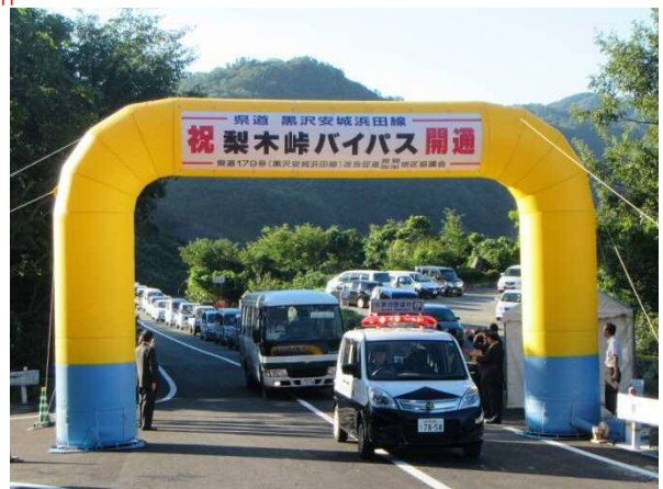
渡り初めの状況（H27.8.27AM7:00頃）