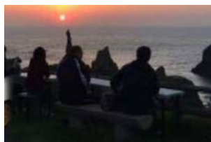
夕日カフェ 観音岩にかかる夕日を見ながら ティータイム♪