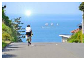
西ノ島サイクリング 秋の爽やかな風の中、摩天崖を駆け抜ける！