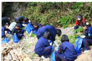
ビーチクリーン ワークショップで楽しみながら、海岸清掃！