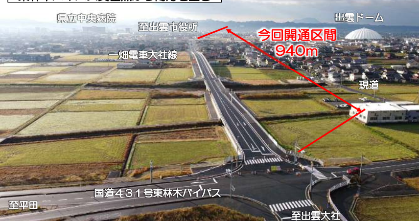
東林木バイパス交差点から南方を望む