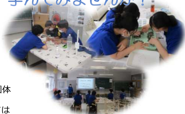
過去に実施した出前講座の様子