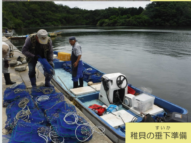
すいか 稚貝の垂下準備