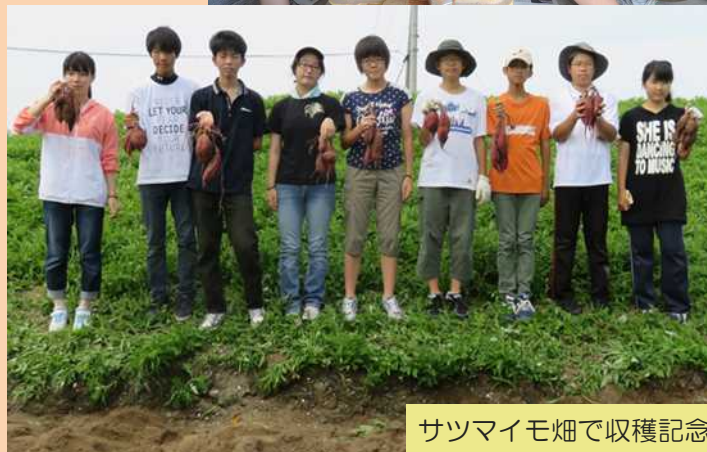
サツマイモ畑で収穫記念