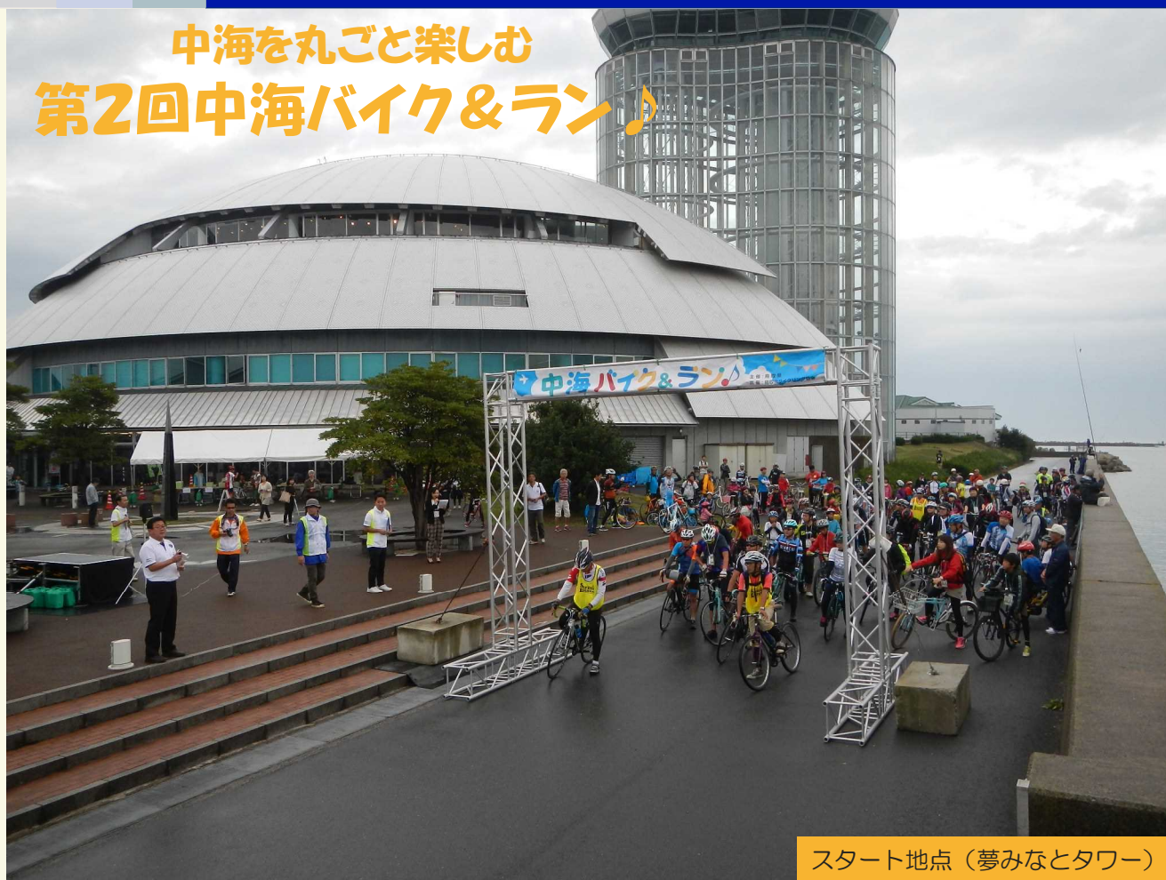
スタート地点(夢みなとタワー)

平成28年10月8日、夢みなとタワーをメイン会場に「第2回中海バイク&ラン♪」を開催しました。