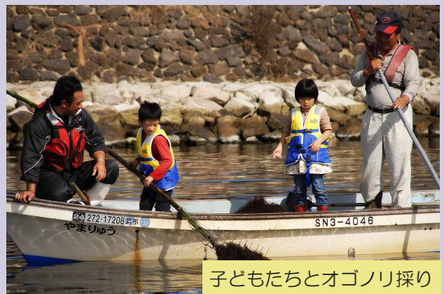
子どもたちとオゴノリ採り