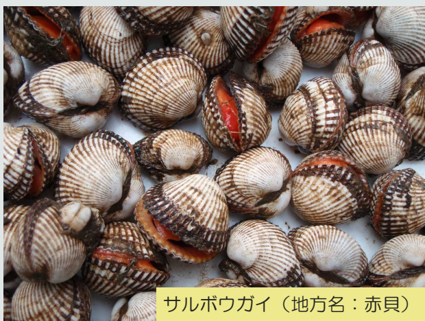
サルボウガイ（地方名：赤貝）

養殖技術は徐々に向上しています。殻に付着するフジツボ等を除去することが最大の課題となっているため、引き続き除去作業を軽減するための対策を検討し、良質なサルボウガイの育成技術の確立に努めていきます。