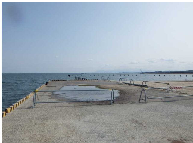
老朽化による棧橋上面のくぼみ