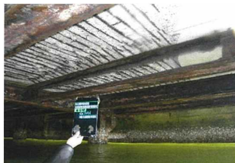
棧橋下面の状況 (床版の剥離による鉄筋の露出)