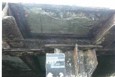
棧橋下面の状況 (床版の剥離、H鋼の腐食)