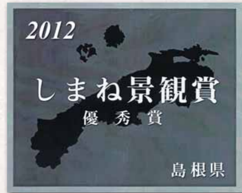
しまね景観賞表彰銘板