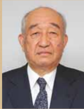
しまね景観賞審査委員会委員長