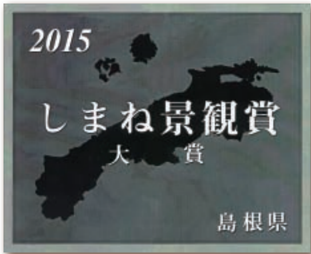
しまね景観賞表彰銘板