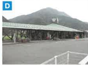
道の駅インフォメーションセンターかむもと 食事、地元の特産品の購入ができる。バスで断魚溪へ行く際には、ここで乗車する。