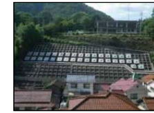
法枠工、アンカー工