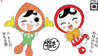
人権イメージキャラクター