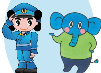
島根県警察 シンボルマスコット みこびーくん