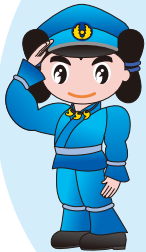
島根県警察 シンボルマスコット みこびーくん