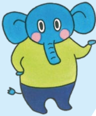
島根県消費者センター マスコットキャラクター だまされないゾウくん