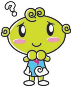
協会けんぽ島根支部キャラクター 「しまめちゃん」

従業員の健康のためにも、ぜひ受けたいんだけど・・・ 出張・外回りの従業員や、県外の支店に勤務していたり・・・ 在宅ワークで会社に来ない従業員もいるけど・・・ コロナも怖いしなあ・・・